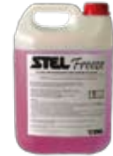
LIQUIDO STELFreeze Cod. 600239000L Tanica 5 Litri per Sistemi di raffreddamento Stel.