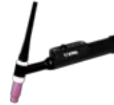
Torcia Tig Torcia Tig per saldatura TIG con comodo pulsante torcia. - Torcia Tig 26 4m H2O Cod. 600706000L - Torcia Tig 26 8m H2O Cod. 600707000L - Torcia Tig 20 4m H2O Cod. 600708000L - Torcia Tig 20 8m H2O Cod. 600709000L