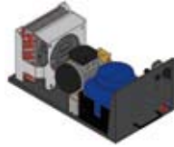
RAFFREDDAMENTO AWC MPS Cod. 601471000L Gruppo di raffreddamento per torce TIG e MIG ad acqua. Potenza di Raffreddamento P = 1 KW (1L/min) Portata con torcia 18 8mt = 1,7 L/min