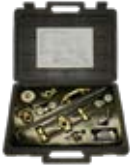
KIT COMPASSO Cod.6074800000 Kit completo guida per torcia plasma.